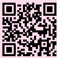
古代蓮の里 QR コード