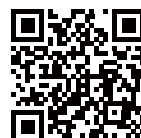
市内循環バス時刻表